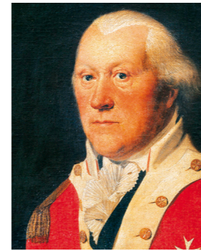
Friedrich Eberhard von Rochow 1734–1805

Auf dem ersten Grundsatz beruhen alle Aussagen der Reckahner Reflexionen und alle sind wechselseitig aufeinander bezogen. Die 10 Leitlinien sind aus Beobachtungen im pädagogischen Alltag hervorgegangen, es geht ihnen also um die Stärkung von Formen der Anerkennung, die im Schul- und Kitaleben vorzufinden sind und in einem kollektiv geteilten menschenrechtlich-demokratischen Verständnis von pädagogischer Anerkennung verankert sind. Die Aussagen des ersten Teils unter der Überschrift „Was ethisch begründet ist“ wurden aus im Feld praktizierten gelingenden pädagogischen Handlungsweisen abgeleitet. Die Aussagen des zweiten Teils „Was ethisch unzulässig ist“ sind Reaktionen auf im Feld praktizierte problematische pädagogische Handlungsweisen. Auch die Vorschläge für „Handlungsebenen der Stärkung pädagogischer Ethik“ sind Anregungen, die allesamt in Praxisfeldern gefunden wurden.