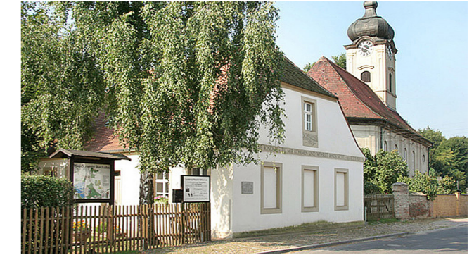
Philanthropische Musterschule Reckahn von 1773, heute Schulmuseum