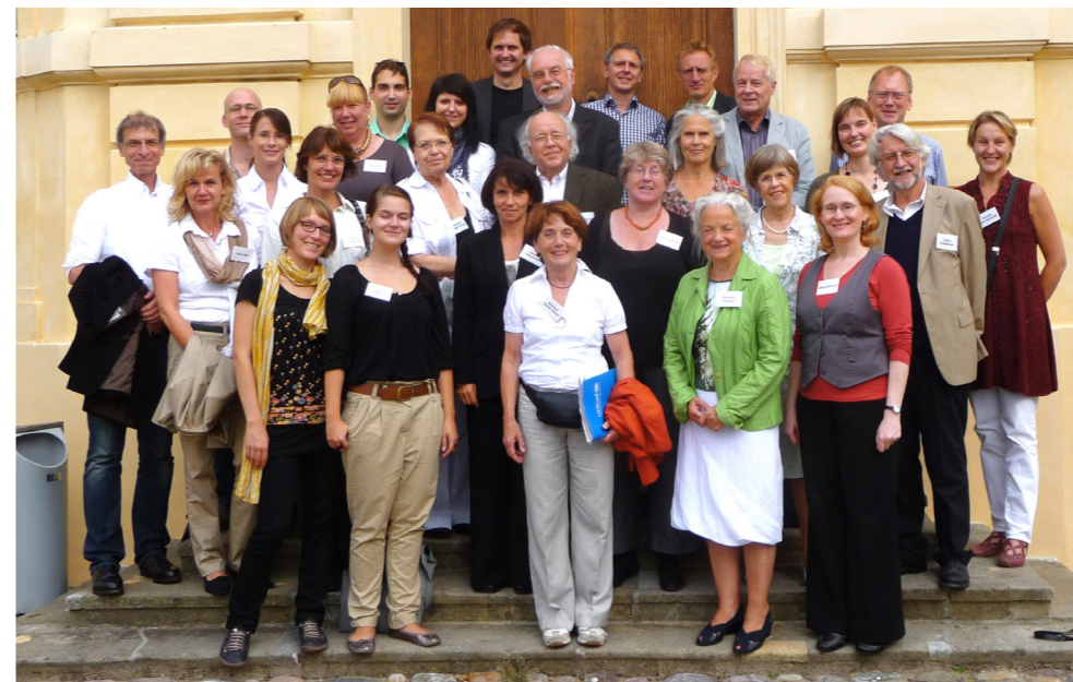
Gründungskonferenz des Arbeitskreises Menschenrechtsbildung im Rochow-Museum Reckahn im Jahr 2011

„Es kommt auf den ersten Empfang der Kinder an. Er muss vorzüglich freundlich und liebevoll sein, damit sie Zutrauen fassen können“ – mit diesen Worten fasste ein zeitgenössischer pädagogischer Augenzeuge seine in der Musterschule gewonnenen Erkenntnisse zur pädagogischen Beziehung zusammen. Er hatte den dortigen Unterricht über ein